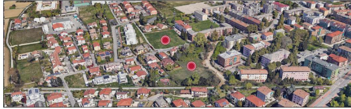
Vista aerea dell'ambito d'intervento in via Etruria (Gazzera).

Variante al Piano degli Interventi n. 57 ai sensi dell'art.18 della L.R.V. 11/2004. Ripianificazione di ambiti in Zona Territoriale Omogenea "C2rs 101-102" in Via Etruria, Via Lucania a Mestre. ADOZIONE